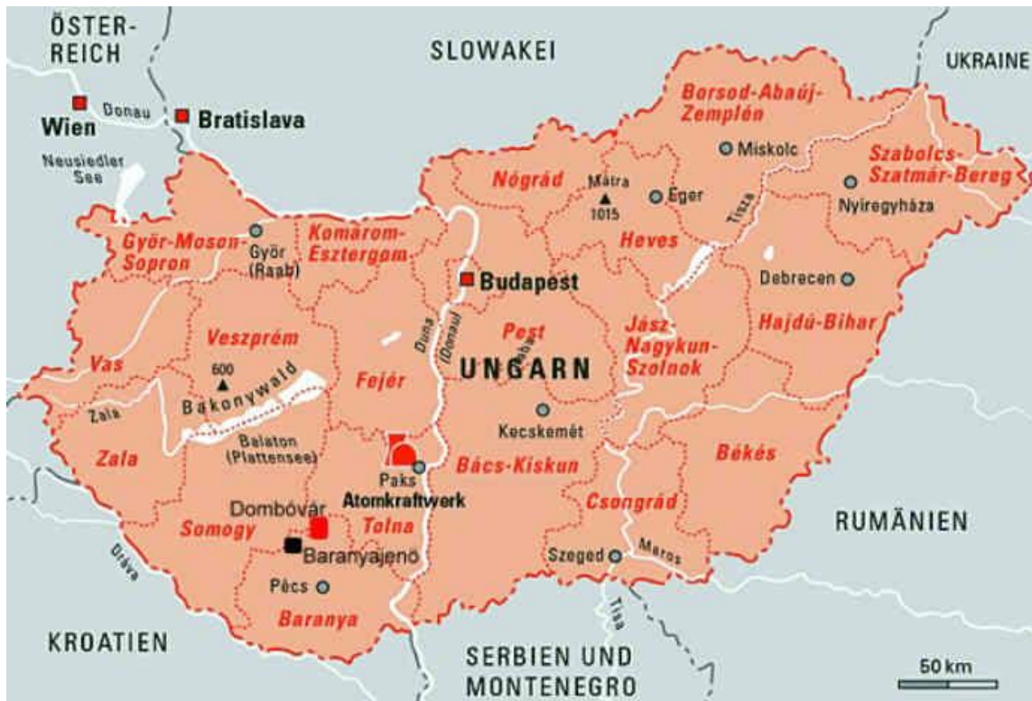
Abbildung 1 Übersichtskarte von Ungarn

Ungarn ist ein Binnenland in Zentraleuropa. Seine Hauptstadt, Budapest, wird von der Donau in zwei geteilt. Das Stadtbild umfasst architektonische Wahrzeichen, wie Budas mittelalterlichen Burgberg und große neoklassische Gebäude an der Straße Andrassy út in Pest bis hin zur Kettenbrücke aus dem 19. Jahrhundert. Türkische und römische Einflüsse auf die ungarische Kultur umfassen die beliebten Mineralspas, wie den Heilsee Hévíz.